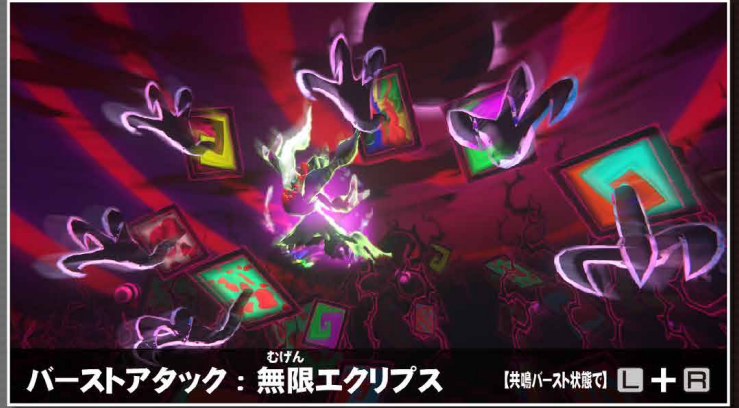
バーストアタック：無限エクリプス 【共通バースト状態で】 L + R

攻撃と同時に幻影を設置し、場を支配して戦うポケモン。特定の攻撃のヒットで発動するナイトメアシフトは強力無比。